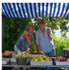
H12RE DINER ZATERDAG

Ga nu naar de website en zorg dat je er weer bij bent.